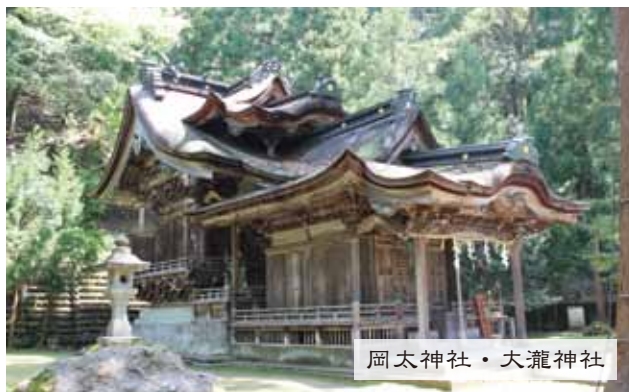
岡太神社・大瀧神社

◆ ①お名前②ご連絡先電話番号③講座名・日程をお伝えください。 ◆ キャンセルは原則として「1週間前までに」ご連絡をお願いします。